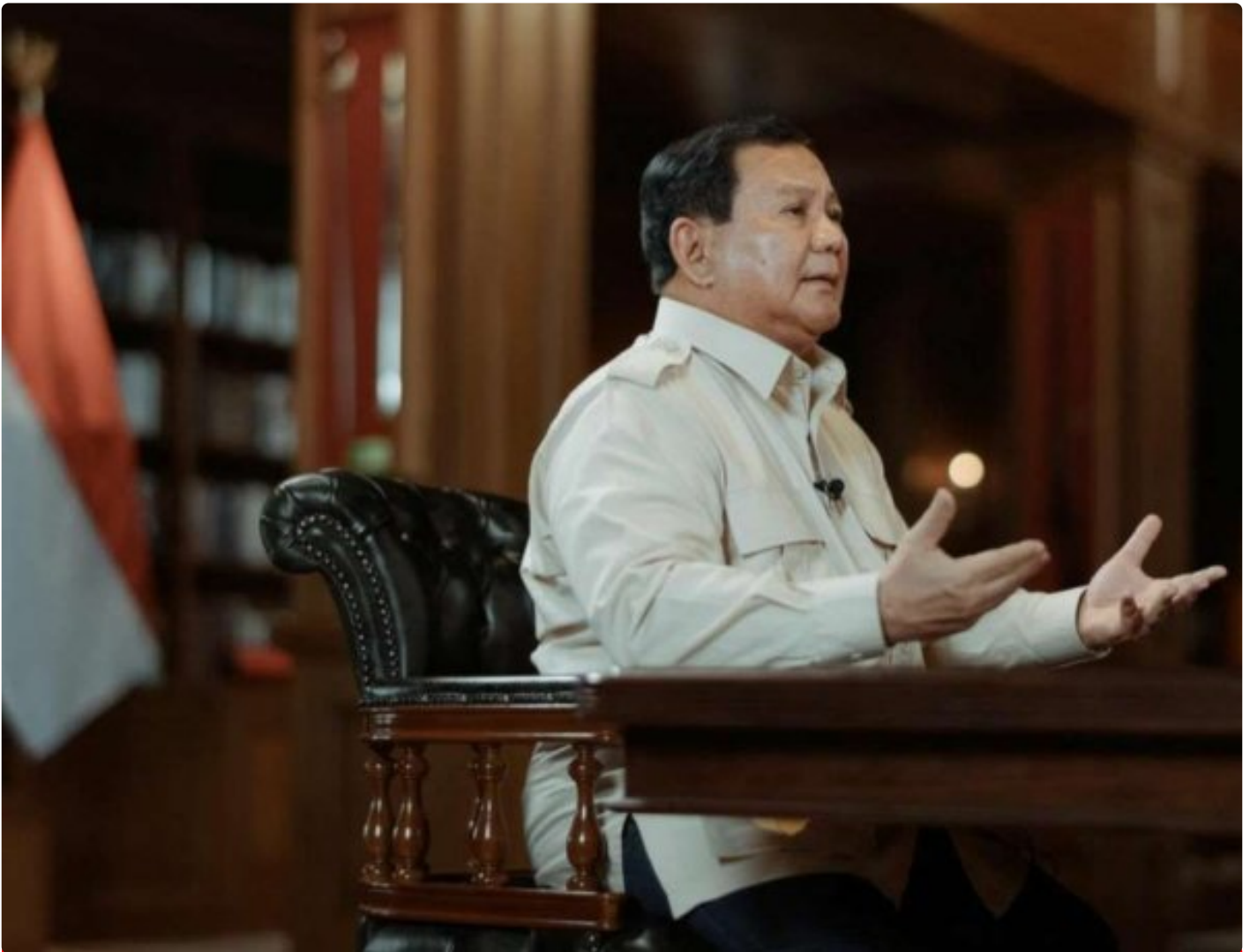
Prabowo Subianto Presiden RI 2024-2029

PENDIDIKAN - Indonesia dikenal sebagai negara yang kaya akan sumber daya alam. Dari hasil tambang yang berlimpah, laut yang luas dengan kekayaan hayati yang melimpah, hutan yang menjadi paru-paru dunia, hingga sumber daya energi yang tersebar di berbagai wilayah, semuanya menjadi kekuatan besar bagi bangsa ini. Potensi besar tersebut seharusnya dapat dimanfaatkan untuk